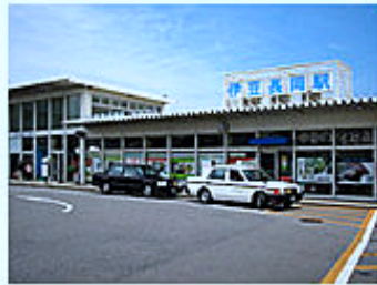
伊豆箱根鉄道駿豆線 伊豆長岡駅を背に直進