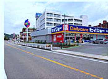
進行方向右手に薬セイジョー すぐ先のセブンイレブンそば