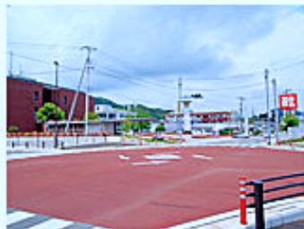
伊豆の国市役所が見える 長岡IC東交差点を右折