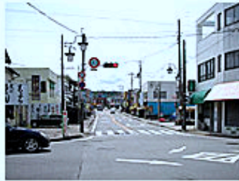
南条交差点をまっすぐ突切り そのまま直進