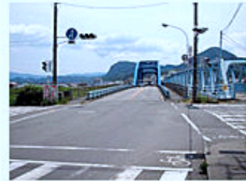
ちとせ橋を渡りそのまま直進 つきあたりを左折