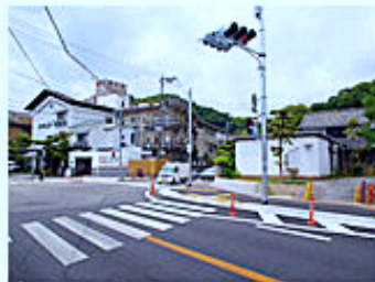
はなぶさが目印の交差点を 伊豆長岡温泉街方面に右折